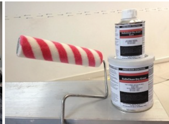
1 cuarto de EeZeClean y rodillo pelos de Angora.

Carrera 15 118-23, oficina 508, Bogotá D.C, Cund 111111. Colombia